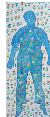
「ヒトのカタチ・プロジェクト」